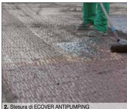
2. Stesura di ECOVER ANTIPUMPING