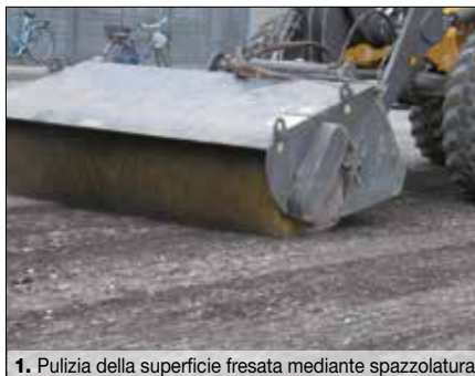
1. Pulizia della superficie fresata mediante spazzolatura

va applicato a spazzolone, rullo, pennello o spruzzo (2).