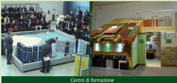
Centro di formazione