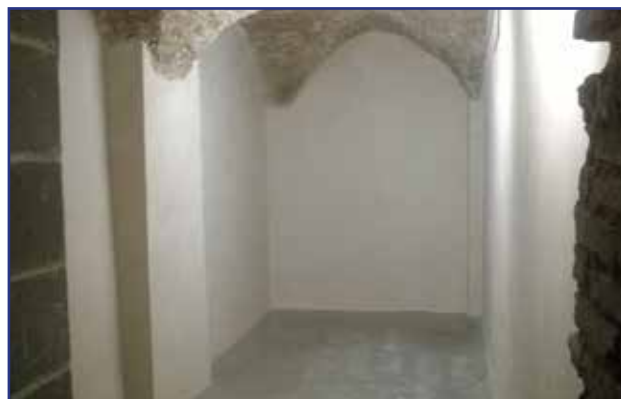
Altri lavori sono disponibili sul sito www.indexspa.it nella sezione "Referenze"